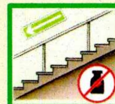
Не храните под лестницами горючие материалы