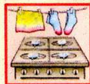
Оставление без присмотра газовой плиты

Отдел надзорной деятельности и профилактической работы Кронштадтского района