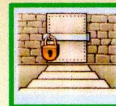
Чердаки и подвалы ограждайте от доступа случайных лиц

Ответственность за нарушение требований пожарной безопасности несут собственники имущества, ответственные квартиросъемщики или арендаторы, руководители предприятий, должностные лица в пределах их компетенции. За нарушение требований пожарной безопасности граждане могут быть привлечены к дисциплинарной, административной и уголовной ответственности в соответствии с действующим законодательством.