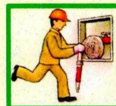
Обеспечьте беспрепятственный доступ к средствам пожаротушения