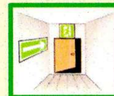
Не загромождайте пути эвакуации